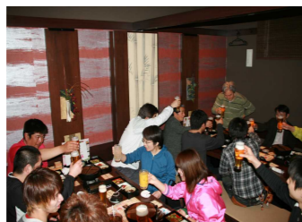
懇親会 南流山にて