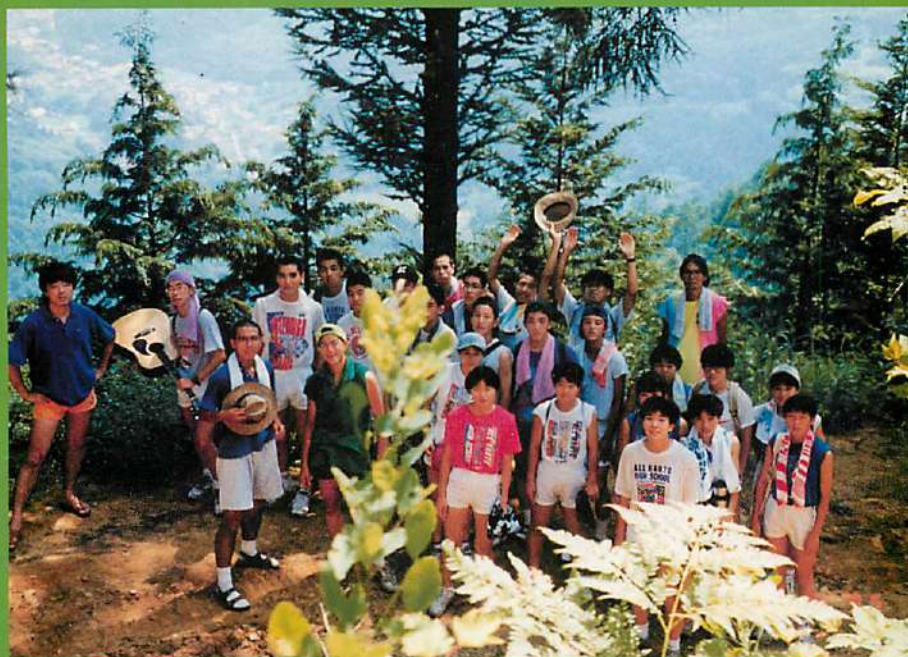
Summer Camp In Shinshu 1995