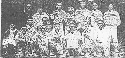
男子で初優勝を飾った西武台千葉(左)と、女子3連覇を達成した東葉の選手団